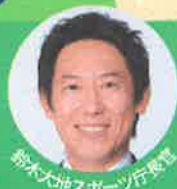
新木大地スポーツ庁長官